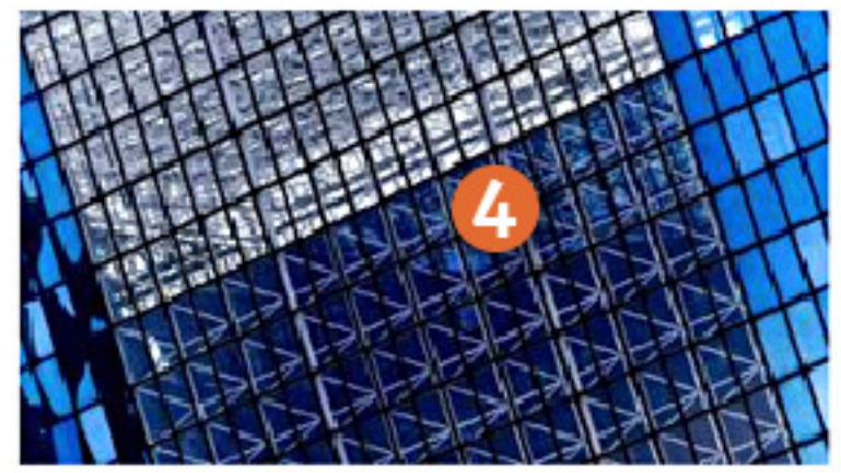
Konsequente, markt- und kundenorientierte Koordinierung aller logistischen Funktionen.

Ihre Waren und Güter sind im Markt top positioniert. Wir sorgen dafür, dass sie in Sachen Logistik ihrem Image gerecht werden und in bester Qualität bei Ihren Kunden eintreffen. Weltweit.